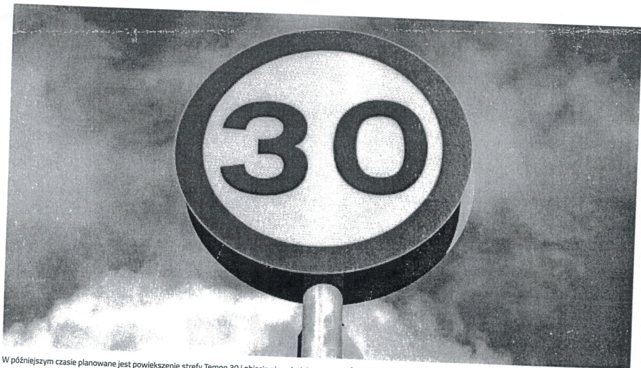
W późniejszym czasie planowane jest powiększenie strefy Tempo 30 i objęcie nią południowej części Śródmieścia w Radomiu

Od środy w ścisłym centrum Radomia obowiązuje strefa Tempo 30. Maksymalna prędkość samochodów w tym obszarze została ograniczona do 30 km na godzinę. Zmiany mają m.in. poprawić bezpieczeństwo ruchu na ulicach, z których korzysta wielu pieszych i rowerzystów.